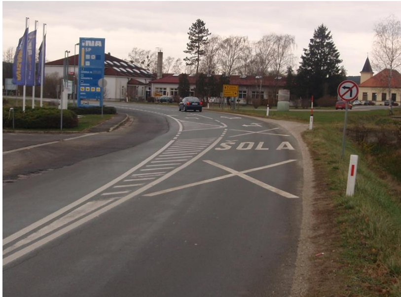
Slika 3: Kritično mesto št.1: Križišče v bližini OŠ Šalovci oziroma odcep regionalne ceste. Ceste za naselje Markovci, ki je v okolici šole brez pločnikov in brez prehoda za pešce.