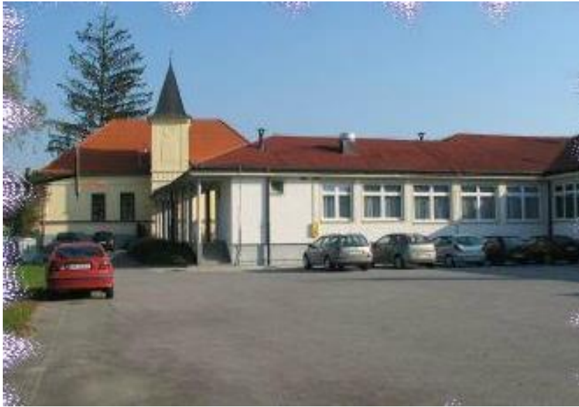
Slika 2: Parkirišče za šolo