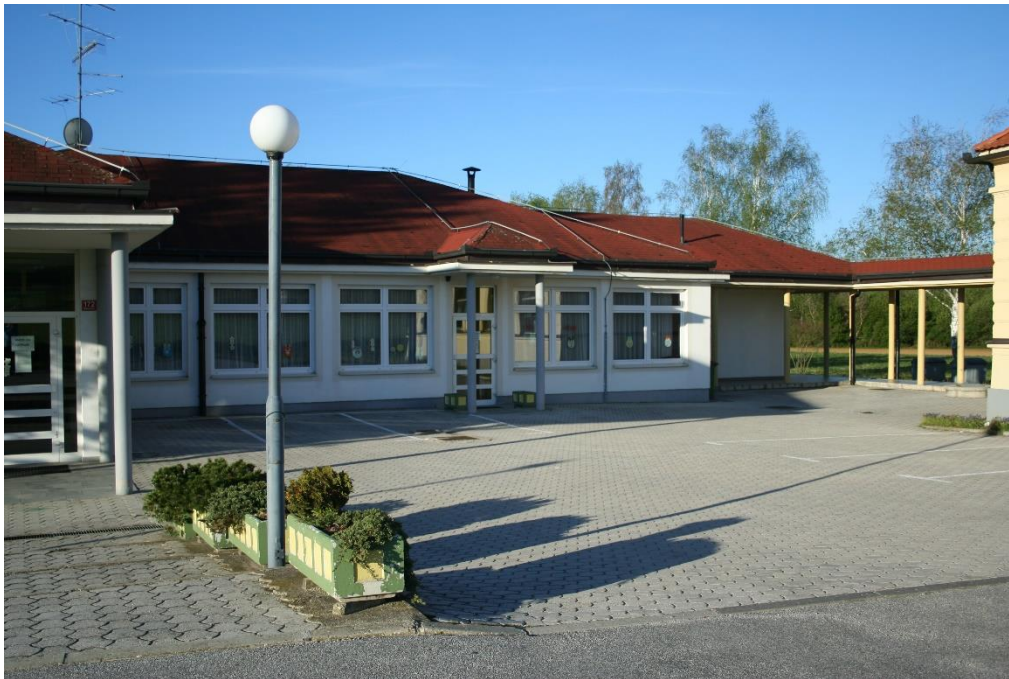
Slika 1: Parkirišče pred šolo