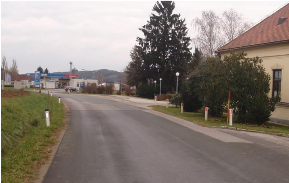
Slika 5: Kritično mesto št. 3: Vidno avtobusno postajališče pri OŠ Šalovci oziroma odcep regionalne ceste za naselje Markovci oz. za OŠ brez prehoda za pešce.