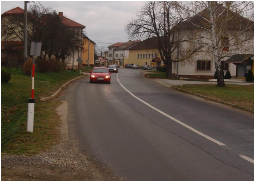
Slika 4: Kritično mesto št. 2: Center naselja Šalovci oziroma občinska stavba in kulturni dom, kjer osnovnošolci OŠ Šalovci pogostokrat obiskujejo razne prireditve brez pločnika.