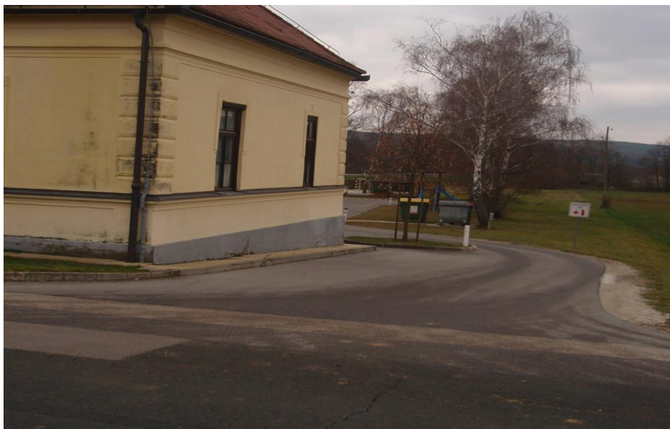
Slika 6: Kritično mesto št. 4: Dovozna pot do OŠ oziroma parkirnih prostorov OŠ Šalovci ter intervencijska pot zaradi nepreglednosti.