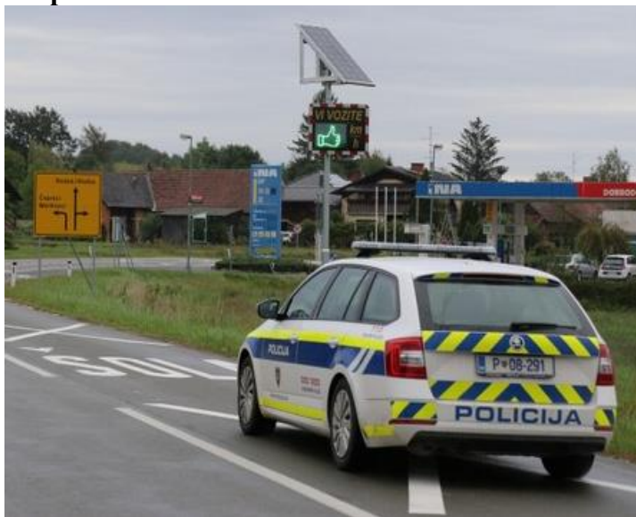
Slika 7: Prikazovalnik hitrosti VI VOZITE MHP50

Občina Šalovci je v sodelovanju s podjetjem Sipronika in Zavarovalnico Triglav na nevarnem cestnem odseku ob regionalni cesti na vstopu v naselje Šalovci postavila prikazovalnik hitrosti »Vi vozite« MHP50. Na ta način bodo poti predšolskih in osnovnošolskih otrok ter drugih pešcev v prihodnje varnejše. Prikazovalnik je del vseslovenskega projekta Skupaj umirjamo promet , v katerem bo že drugo leto zapored ob sofinanciranju največje slovenske zavarovalnice 12 slovenskih občin aktivno umirjalo promet v naseljih, v bližini šol, vrtcev in na šolskih poteh. V prvem tednu postavitve se je delež prehitrih voznikov zmanjšal za 11 odstotkov. Hitrost ubija, že nekaj let opozarja slovenska policija. Večina prometnih nesreč, kar 46 odstotkov, se zgodi na lokalnih cestah v naselju. Ko gre za pešce, so podatki še bolj alarmantni. Hitrost vozila je namreč najpomembnejši dejavnik, ki vpliva na teže posledic prometnih nesreč, v katerih so udeleženi pešci. Ker je že manjše znižanje hitrosti ključno za preprečevanje hudih prometnih nesreč, je umirjanje prometa v naseljih, kjer so pešci najbolj izpostavljeni, med ključnimi elementi preventivnega delovanja in učinkovit ukrep za zmanjšanje števila prometnih nesreč.