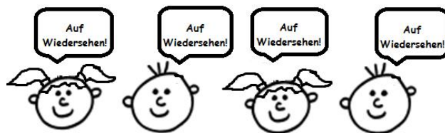
sagen alle Kinder.