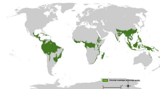
(SLIKA 2: Območje kjer prevladuje tropski deževni gozd)