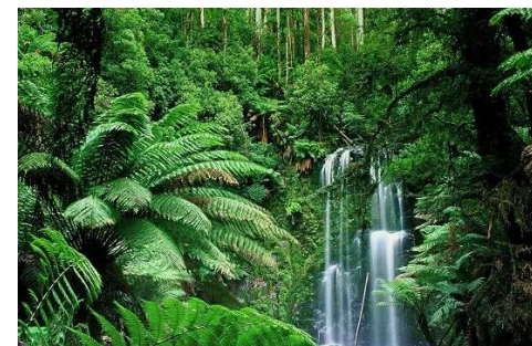
(SLIKA 1: Tropski deževni gozd v Novi Gvineji)