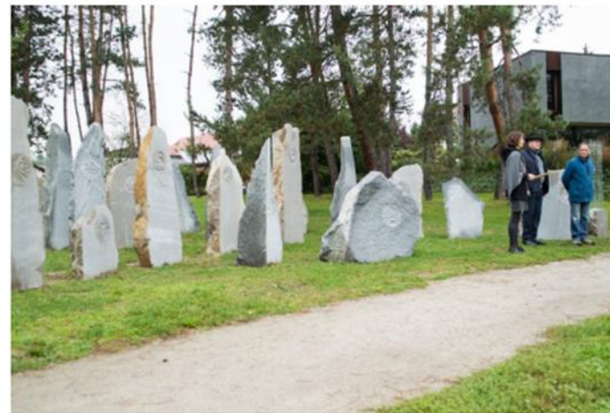
Otvoritev Geopunkturnega kroga v Mestnem parku v Mariboru, 2017.

RAZMISLI. KJE SO VZROKI, DA SE GAJA NE POČUTI NAJBOLJE? ONESNAŽEVANJE NARAVE JI VERJETNO RES NE DANE PRAV DOBRO? SE DOGAJA ŠE KAJ TAKŠNEGA, KAR BI LAHKO SLABO VPLIVALO NA NJENO POČUTJE?